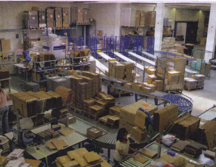
Versandabwicklung im automatisierten Prozess.

Modulare Software für die Versandlogistik bei Verlagen. Unternehmen müssen fortwährend ihre Prozesse optimieren. Ein weltweit tätiger Verlagsauslieferer setzt deshalb auf ein modulares und individuell anpassbares Versandsystem, das alle notwendigen Schritte im Rahmen der Warenausgangs-Logistik automatisiert übernimmt: von der Kommissionierung der Ware, der Versandabwicklung über verschiedene Frachtführer bis hin zur Kontrolle der Versandabschlüsse.